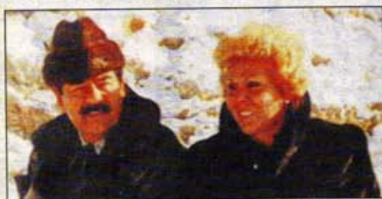
No oil paintings . . . Saddam and Sajida Talfah